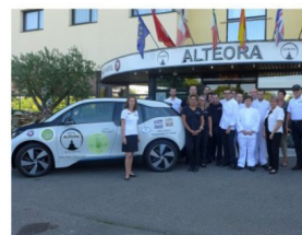
Hôtel Altéora Bernard MARET