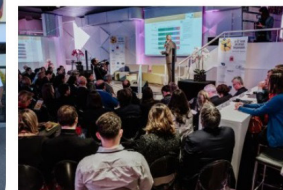
Les achats responsables, créateurs de valeur et d'innovation

18 juin 2019 à Bordeaux RDV régional de l'Institut National de l'Economie Circulaire